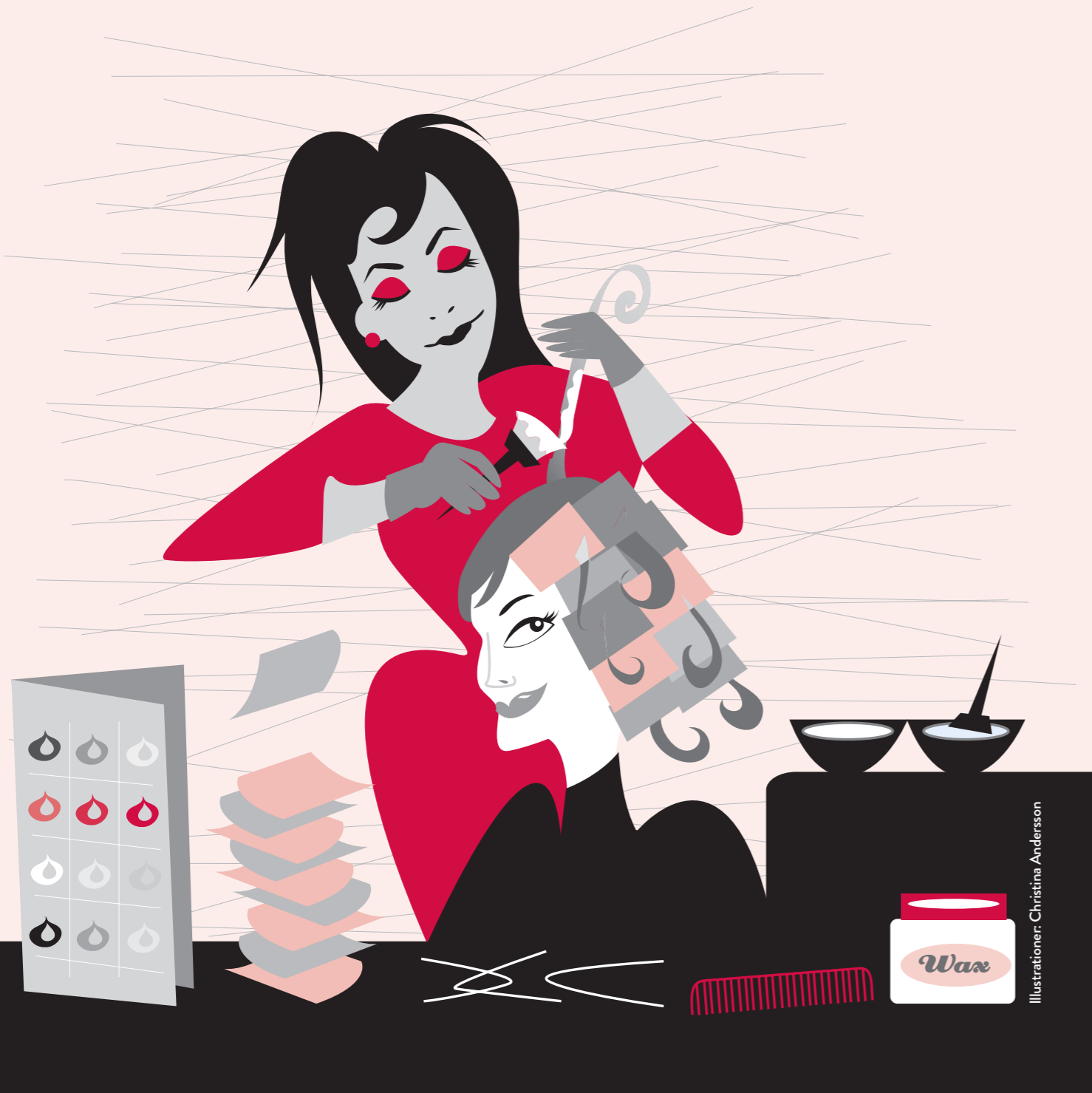
Illustrationer: Christina Andersson